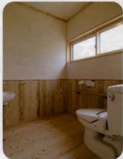
トイレは車椅子がそのまま入るスペースを確保しました。

個室は、和室と洋室の2タイプをご用意しました。入口には部屋の名前の植物を描いた手がき作品が飾られ、訪れる人をやさしく迎えます。