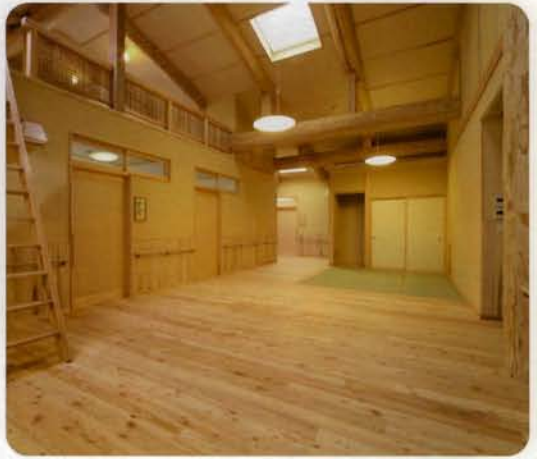
ショートステイの共同生活室にある畳スペースは、お茶の間感覚のくつろぎの場です。

個室は、和室と洋室の2タイプをご用意しました。入口には部屋の名前の植物を描いた手がき作品が飾られ、訪れる人をやさしく迎えます。