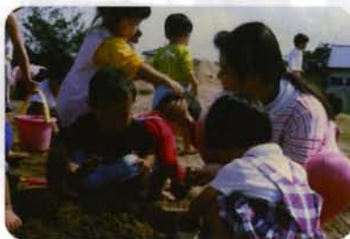
風の子保育園 TEL 0256-72-8545