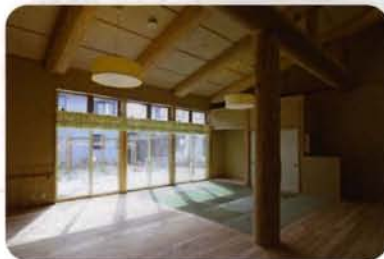
とちの木デイサービスセンター