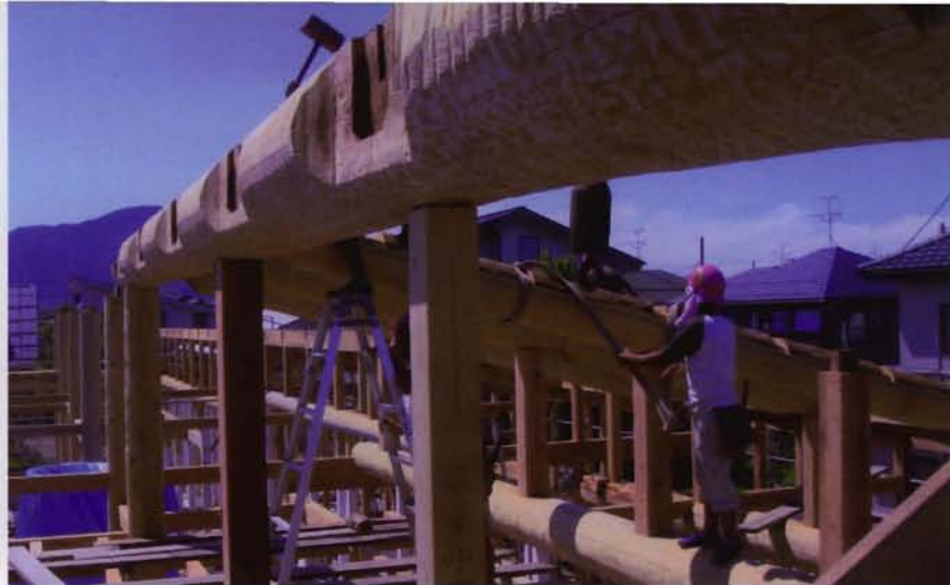
とちの木ショートステイは田中工務店の「クラフトエース工法」によって建てられています。

とちの木ショートステイは、屋根や床など、建物全体を土で覆う「土造り」です。木と土と紙をうまく組みあわせることによって、屋内の寒暖の差を小さくし、湿気を抑え、体にやさしい安定した住環境を確保します。