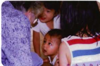
春風デイサービスセンター